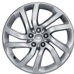
20" O 5 DZIELONYCH RAMIONACH 'WZÓR 5011'