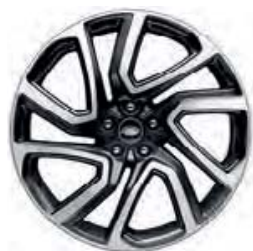
22" O 5 RAMIONACH DZIELONYCH 'WZÓR 5025' DIAMENTOWANE Z WYKOŃCZENIEM SATIN DARK GREY