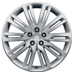
21" O 10 RAMIONACH DZIELONYCH 'WZÓR 1012'