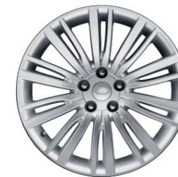
20" O 10 DZIELONYCH RAMIONACH 'WZÓR 1011'