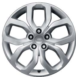
19" O 5 DZIELONYCH RAMIONACH 'WZÓR 5021'