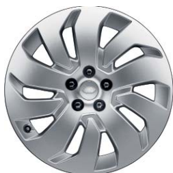
20" 10-RAMIENNE AERO 'WZÓR 1035'

*standardowo z silnikiem 3.0 340KM **niedostępne z silnikiem 3.0 340KM