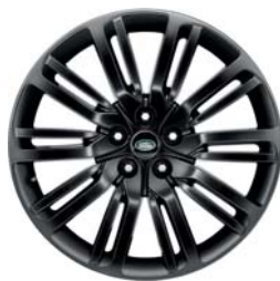
21" O 10 RAMIONACH DZIELONYCH 'WZÓR 1012' Z WYKOŃCZENIEM GLOSS BLACK