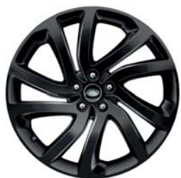
22" O 5 RAMIONACH DZIELONYCH 'WZÓR 5011' Z WYKOŃCZENIEM GLOSS BLACK

Wymagają zamówienia zawieszenia pneumatycznego 027BY