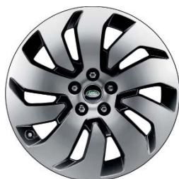
20" 10-RAMIENNE AERO 'WZÓR 1035' DIAMENTOWANE