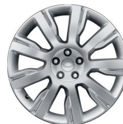
21" 9-RAMIENNE 'WZÓR 9002'