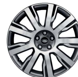
21" 9-RAMIENNE 'WZÓR 9002' DIAMENTOWANE