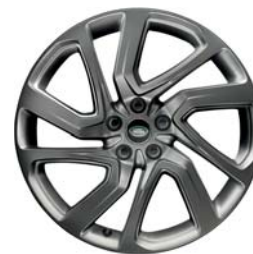
21" O 5 RAMIONACH DZIELONYCH 'WZÓR 5025' Z WYKOŃCZENIEM SATIN DARK GREY