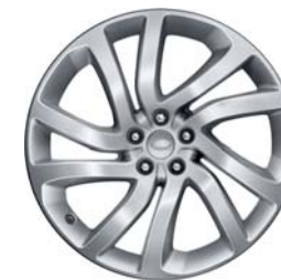
22" O 5 RAMIONACH DZIELONYCH 'WZÓR 5011'