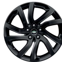
20" O 5 DZIELONYCH RAMIONACH 'WZÓR 5011' Z WYKOŃCZENIEM GLOSS BLACK